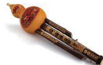
Flûte à calebasse chinoise

Du 25 au 27 mars les passionnés vous invitent à découvrir et à partager. Découvrir des émotions insoupçonnées, partager des spectacles qui les ont touchés. Ce serait une drôle d'idée que de s'en priver.