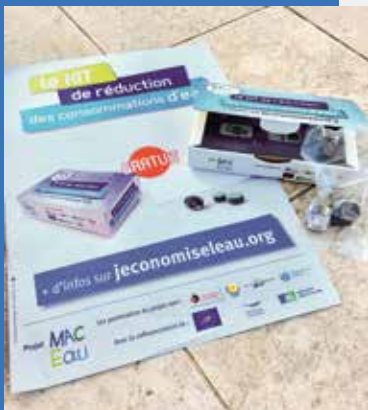
Kit économiseur d'eau

> Ordures ménagères : le passage à une collecte des ordures ménagères par semaine hors du centre-ville a fait baisser la contribution fiscale des usagers.