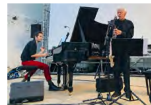
Concert événement Jeudi 14 avril

pour un Jeudi du Jazz exceptionnel avec Michel Portal & Roberto Negro. Rencontre inédite au sommet entre Michel Portal, légende vivante du jazz européen, et Roberto Negro, étoile montante de la scène improvisée française ! Tout public. Tarifs : Jeune : 12€ / Réduit : 15€ / Plein : 20€. Infos : 05 56 30 65 59.